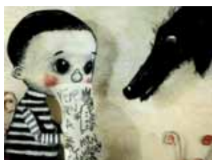
Titel und Szene aus dem Film „Wutmann“