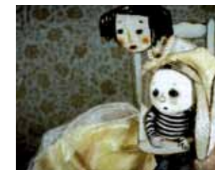
Szenen aus dem Film „Wutmann“