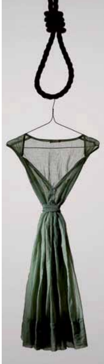
„Laß dir helfen, bevor es zu spät ist“