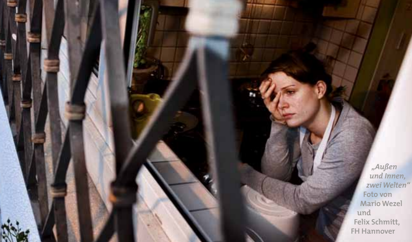
„Außen und Innen, zwei Welten“